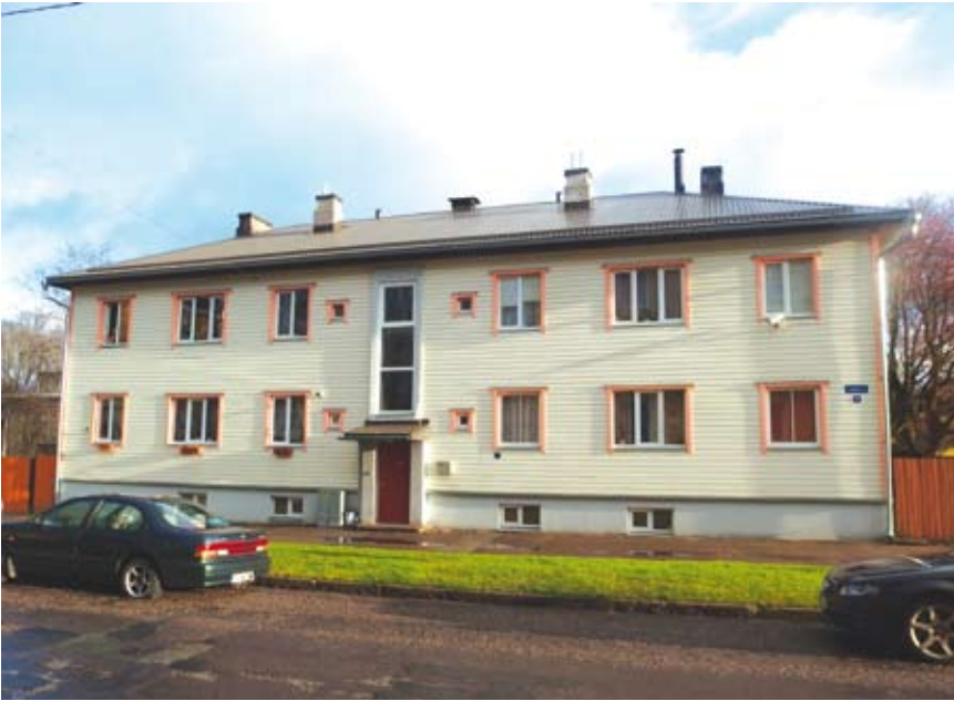
Tallinnan Löime-kadulla 1940-luvun työläisparakki on saatettu suorastaan idylliseen kuntoon.