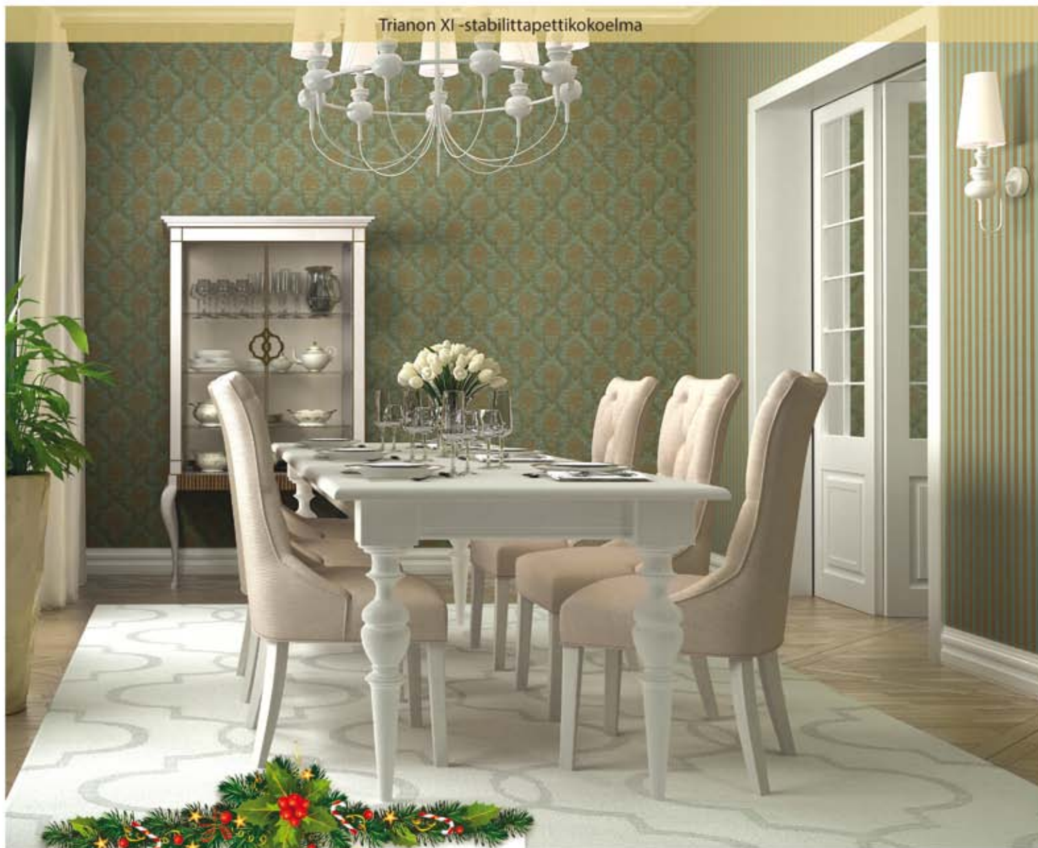
Trianon XI -stabilittapettikokoelma