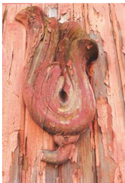
Tallinnassa vanhat nikkaritaidotkin ovat usein tarpeellisia, kun remontoidaan puutaloja.

Tallinnassa on jäljellä melkoisen iso puutalokanta, esimerkiksi Kalamajan vanhassa kaupunginosassa, ja moni rakennus on myös suojeltu. Olen vuosia kierrellyt Tallinnan reuna-alueita ja olen surukseni huomannut, että yksi tapa, jolla grynderit kiertävät tiukkoja suojelumääräyksiä, on ollut tuikata talo